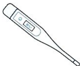
Fièvre > 38°C